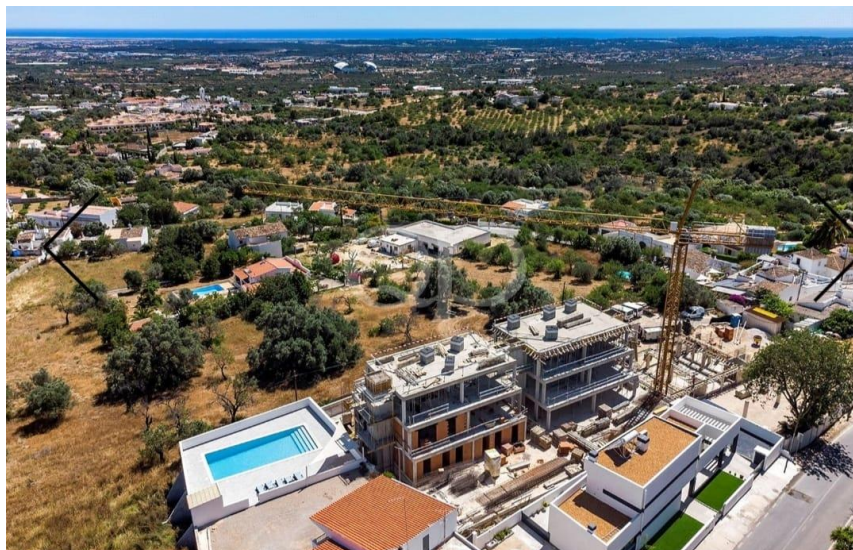
Fig 1 – Vista de cima do empreendimento.