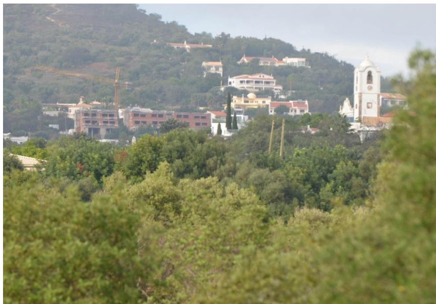
Fig 2 – Vista a partir da Via do Infante